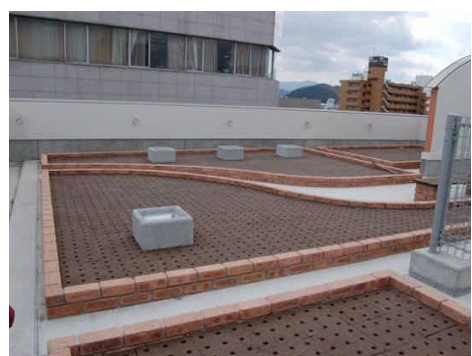
（図 4 - 2）