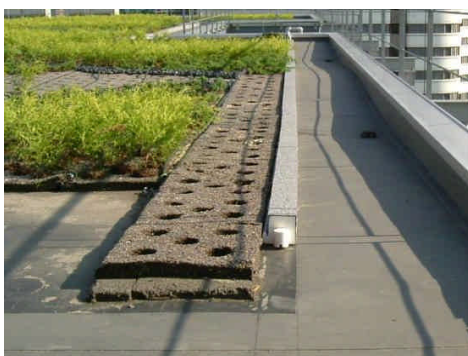
（図 4 - 1）

仕切材を任意の場所に設置する。仕切材はデザイン上必要な場合に設置する。設置方法、固定方法は使用する仕切材の素材、形状に適切な方法を選択する。（図 4 - 1、4 - 2 参照）