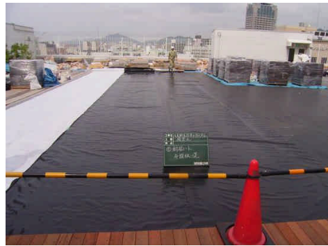
（図 3 - 1）

防水シートを設置する場合（建物の防水施工が十分でない場合は防水シートを設置した上に、防根シートを敷設する。（※防水施工は本基準書に準じない。）