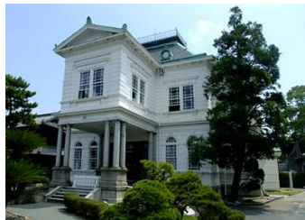
↑旧立花寛治伯爵邸 西洋館

西洋館は迎賓館として建てられた、白亜の洋館で、木造2階建ての建物です。正面屋根は三角破風のペディメントが採用され、玄関ポーチにはトスカナ式の円柱が用いられた、フレンチ・ルネッサンス様式の建物です。裏側には1本真っ白な煙突があり、煙突上部には紋様が裝飾されており大変優雅な印象を受けます。室内は、重厚なエントラス、格調高い大広間、シャンデリアやオルガンなどの調度品は明治の華やかな生活をうかがわせます。御花は『松濤園』を含めて敷地全体が「立花氏庭園」として国指定名勝となっています。