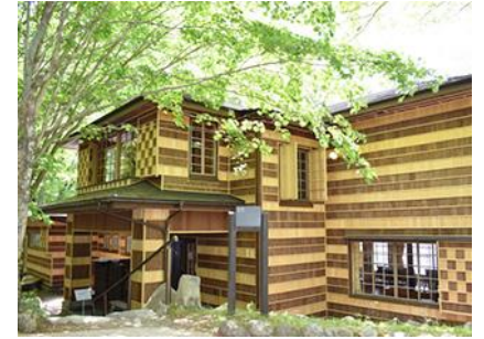
旧イタリア大使館別館

この建物は、有名な建築家アントニン・レーモンドが1928年に建築したもので、1997年まで歴代の大使が使用していました。外観や内装の壁に、日本の伝統文様である市松模様や網代などが取り入れられていて、和洋折衷の美しさとセンスの良さが光ります。室内は玉石の暖炉、日光の杉で作られた壁や天井、借景という日本の文化を利用した洋風な広縁など、モダンでありながら日本建築の伝統を反映したデザインが、絶妙に自然と一体化し周囲の環境に溶け込んでます。現在はイタリア大使館記念公園として一般公開されています。