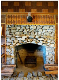
玉石と杉皮による模様が美しい暖炉